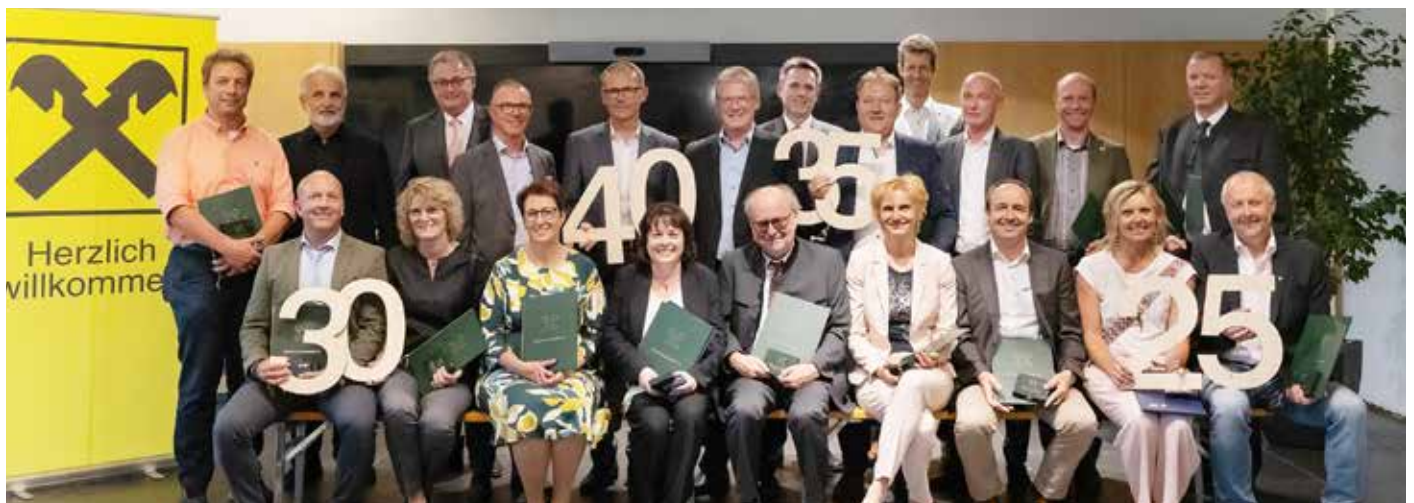
Ehrung langjähriger Mitarbeiter und Funktionäre von Jochberg bis Hochfilzen

Die Regionalbank steht Vereinen und Projekten in den Bereichen Sport, Kunst und Kultur, Soziales und Bildung zur Seite. Im Jahr 2022 belief sich die Unterstützung auf rund 175.000 Euro. Verlässliche Partnerschaft und das Mit.Einander haben auch als Arbeitgeber oberste Priorität, u.a. die Vereinbarkeit von Familie und Karriere, berufliche und persönliche Entwicklung oder Gesundheit. Am 31.12.2022 waren 125 Mitarbeiter/-innen beschäftigt. -red-