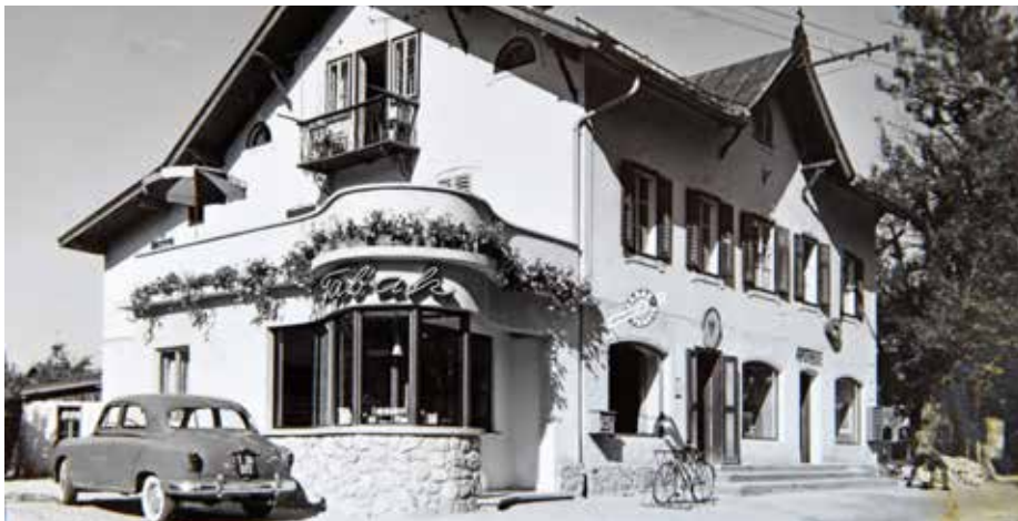
Das „Maier Haus“ war damals und ist heute ein florierendes Geschäftshaus im Herzen Kirchbergs.