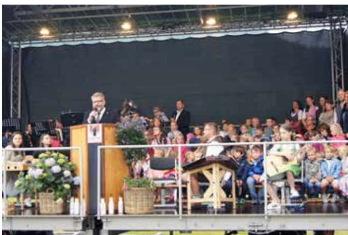
Fast vier Jahre nach der Fertigstellung wurde Mitte Juni das moderne Reither Bildungszentrum eingeweiht

Ein tolles Spielefest und offene Türen im Bildungszentrum und im Schützenheim sowie das erste Platzkonzert der Musikkapelle Reith sorgten für ein erfolgreiches und gut besuchtes Einweihungsfest. -rw-