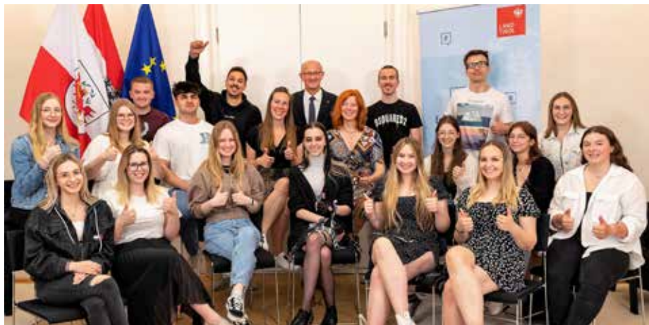
Die 3B der Tiroler Fachberufsschule Kitzbühel besuchte Landeshauptmann Anton Mattle in Innsbruck.