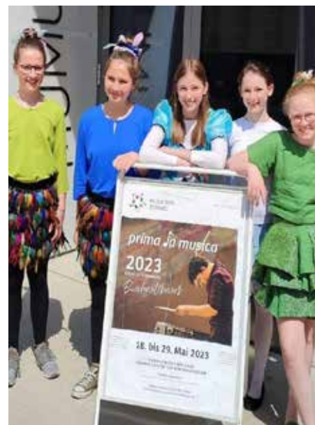
1. Preis beim Bundeswettbewerb für das Ensemble „Alice im Wunderwald“.