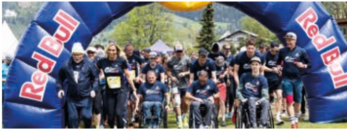
Prominent besetzter Start 2025 in Saalfelden.

Sonntag, 10. Mai 2026 – 13:00 Start im Stadtzentrum Saalfelden.