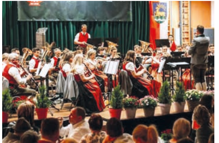
Die Weißbacher Musi startete erfolgreich in ihr Jubiläumsjahr.