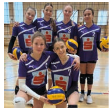
Das erfolgreiche Volleyballteam