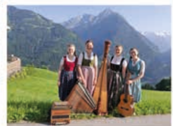
Musikalische Begleitung „Die Zoigal“ Waidring