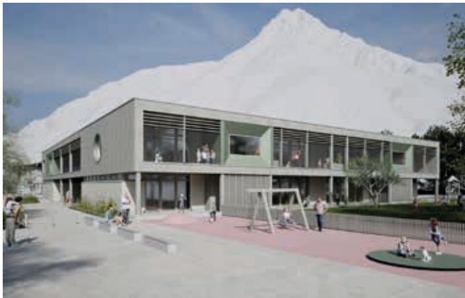
Das moderne Bildungszentrum soll im Herbst 2027 bezugsfertig sein.