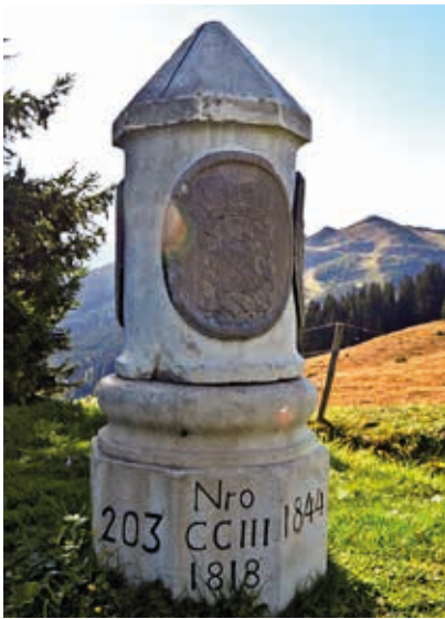
Grenzstein am Scheiblberg, Jahr 1818.