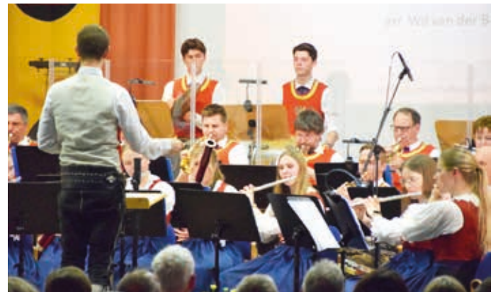
Facettenreiche Blasmusik vom Feinsten begeisterte in Waidring.

Zur Begrüßung erklang die attraktive wie anspruchsvolle Komposition „El Gato Montes“, eine Verbindung aus Marschelementen und spanischem Paso Doble. Auch „Der Zigeunerbaron“, die Strauss-Ouvertüre der Ober-/Höchststufe forderte alle Register. Den ersten Programmteil komplettierten interessante Werke wie „Fliegermarsch“, „Schmelzende Riesen“ in Erinnerung an den rasanten Gletscherschwund und „Triglav Marsch“, eine Hommage an den höchsten Berg Sloweniens.