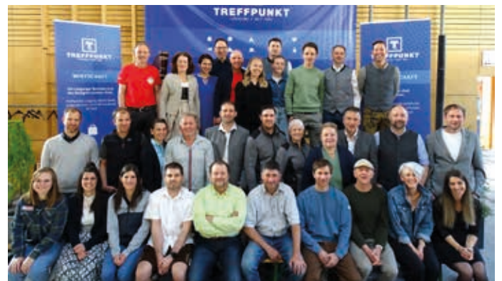
Die Organisatoren und Vertreter der teilnehmenden Betriebe.