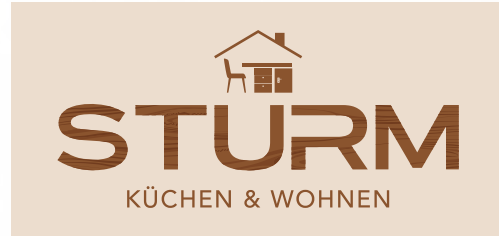
Unser neues Logo