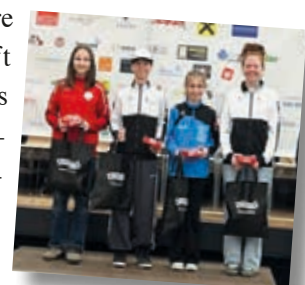
Mannschaftssieg in der Luftgewehr-Jugend 2. Klasse.