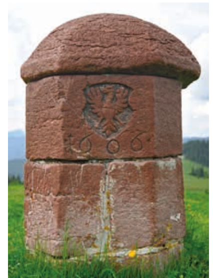
Schwammerling, eine Grenzmarkierung nahe Kammerkör.

Es gäbe aus der Grenzregion noch viele Anekdoten und Begebenheiten, die zum Schmunzeln als auch zum Nachdenken veranlassen. Mit dem österreichischen EU-Beitritt verloren diese Grenzen ihre Bedeutung. Die Grenzstationen wurden mit 1. April 1998 größtenteils aufgelöst bzw. stillgelegt. -red-