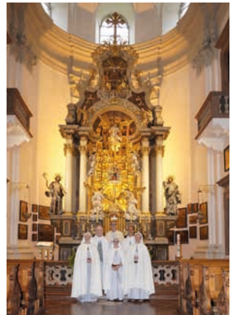
Die Ordensgemeinschaft „Oase des Friedens“ lädt ein zum Jubiläumsjahr von Maria Kirchentäl.