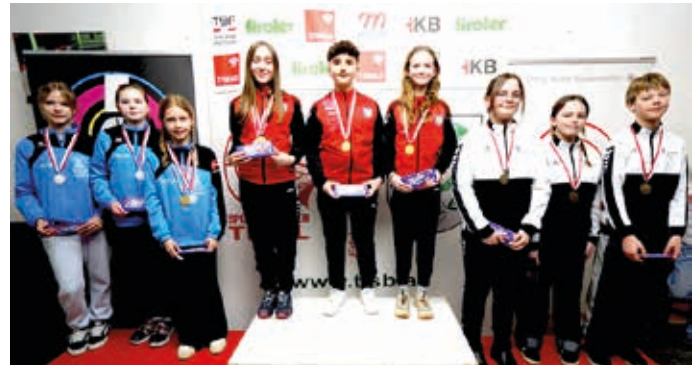
Tiroler Meisterschaft: SG Fieberbrunn (2.), SG Pillersee (3.).