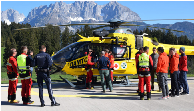
Infos aus erster Hand erhalten Einsatzorganisationen am C4-Stützpunkt in Reith.

Vertreter der Einsatzorganisationen wurden kürzlich am C4-Stützpunkt in Reith über die Neuerungen in der Flugrettung im Bezirk informiert. Ab der Sommersaison wird der Christophorus 4 bis 21:30 Uhr einsatzbereit sein – bisher enden Einsätze mit Sonnenuntergang. Und ab Herbst steht den Rettungskräften ein neuer Hubschrauber mit Rettungswinde außen und Autopilot zur Verfügung. Diese Technik erlaubt es, Einsätze auch unter schwierigen Bedingungen schnell und sicher durchzuführen.