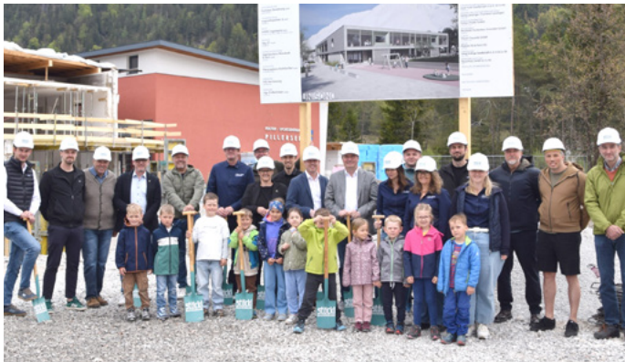
Große Freude über den guten Verlauf des Projekts - Im Juni wird das Obergeschoss in Holzbauweise errichtet.

Viele Millionen werden in St. Ulrich in die Neuausrichtung der Betreuung und Ausbildung von Kindern investiert. Mit dem Neubau des Kindergartens hat eine mehrjährige Projektphase begonnen. Nach dessen geplanter Fertigstellung bis Spätsommer 2027 steht in den Folgejahren die Adaptierung und Modernisierung der Volksschule auf der Agenda.