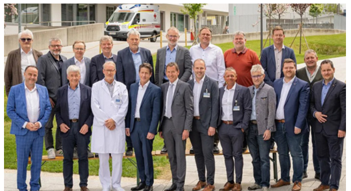
Die Bürgermeister des Bezirkes mit der Kollegialen Führung des Krankenhauses.