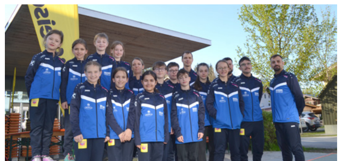
Aktive mit Trainerteam beim Kaiserwinkl Open.

kleine Fehler entschieden letztlich zugunsten der Gegnerin, wodurch Raya die Silbermedaille gewann.