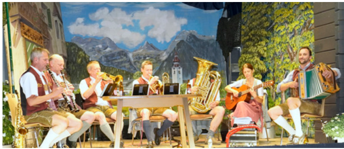
Die Blechbuam sorgen auf der Bühne im Theater Lofer für Stimmung.