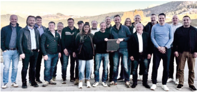
Vertreter von elf Netzwerk-Metall-Betrieben waren in Waidring zu Gast.