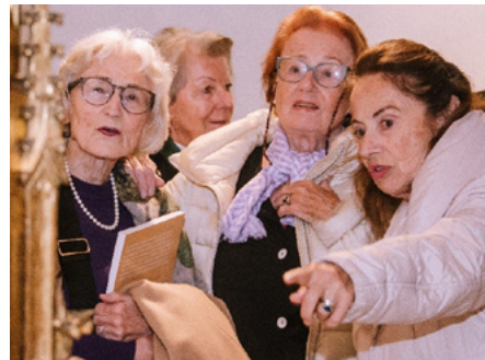
Besucher bestaunen die gotischen Meisterwerke.

Im Zentrum der Sonderausstellung „Meisterwerke der Möbelkunst – Salzburg 1450-1500“, eine Gastausstellung des Salzburg Museum, steht die in der Mitte des 15. Jahrhunderts entstandene Werkstatt des Lungauer Künstlers Petrus Pistator. Der Direktor des Salzburg Museum, Dr. Martin Hochleitner,