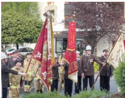
Georgikirchgang der Feuerwehren.