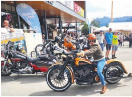
Ausfahrt am Samstag