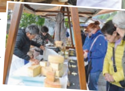
Ob Suppe, Spatzl oder Brot – die Käsegerichte waren begehrt.

Beim Kaiserwinkl Kasfest Mitte Mai waren alle Käseproduzenten der Region vertreten – ebenso die Käsefreunde, die sich das jährliche Erlebnis unter freiem Himmel nicht entgehen lassen.