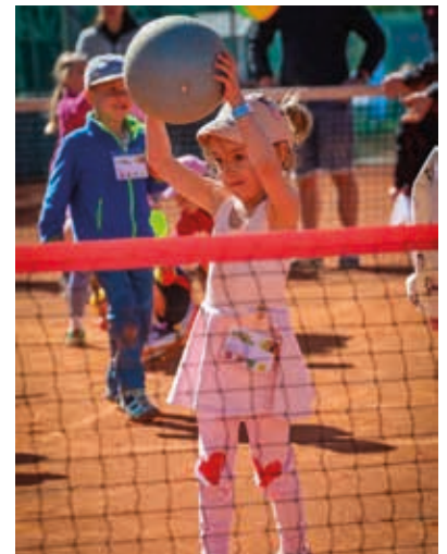
Ein gutes Ballgefühl ist wichtig.

Mit 57 Buben und 48 Mädchen sowie einer starken regionalen Beteiligung – insbesondere aus Ebbs und Niederndorf – zeigte sich einmal mehr, welches Potenzial in der Nachwuchsarbeit steckt. Die positive Stimmung, die vielen lachenden Gesichter und das große Interesse am Tennissport machen deutlich: Aktionen wie „Tennis & Fun“ sind ein wichtiger Baustein, um Kinder nachhaltig für Bewegung und Tennis zu begeistern. Der TC Sparkasse Ebbs blickt nach diesem gelungenen Auftakt motiviert auf die kommende Saison und freut sich auf viele weitere junge Talente auf und neben dem Platz. -be-