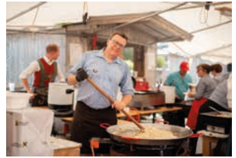
Traditionelle Köstlichkeiten von Vereinen und Gastronomie.

Wenn der erste Schnitt des frischen Grases getätigt und das Heu davon eingebracht war, dann wurde gefeiert. Schließlich sicherte die Egascht-Mahd den ersten Teil der Wintervorsorge. Dieser Tradition blieb man im Kaiserwinkl treu und am Pfingstsonntag wurde in Walchsee zum Egaschtfest eingeladen.