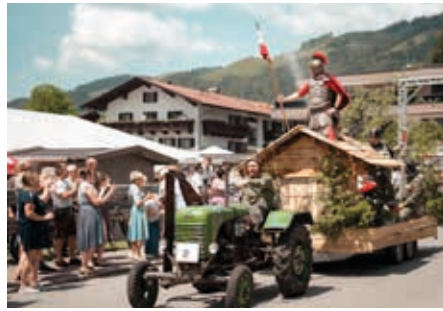
Der Umzug der alten Traktoren faszinierte viele Zuschauer.