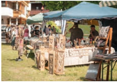
Etlische Kunsthandwerker bereicherten das Fest.