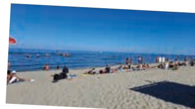
Freier Strand und angenehme Wassertemperatur in Chioggia.

wurden die Reisenden überrascht mit einem Zwischenstopp in Pieve di Cadore, dem Geburtsort des Malers Tizian, von dem ein Bild der „Stillenden Madonna mit dem Kind“ in der Kirche besichtigt wurde. Chioggia wird auch „klein Venedig“ genannt und ist die wichtigste Hafenstadt für den Fischhandel in Norditalien - dort durchquerten wir auch den Fischmarkt mit seinen Köstlichkeiten. In Padua erstaunte die Größe der Basilika des Hl. Antonius. Die Schifffahrt nach Venedig und der Stadtrundgang war für alle ein besonderer Tag. Neben lauen Abenden blieben einige Stunden Zeit für das Baden im Meer oder im Pool. -be-