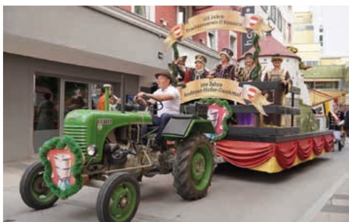
Der Trachtenverein „D'Koasara“ mit ihrem aufwändigen Festwagen.