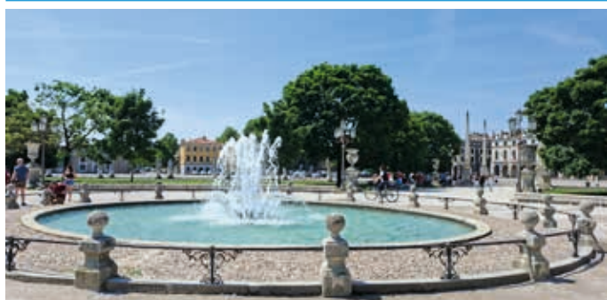
Große Plätze umrahmen die Altstadt von Padua.