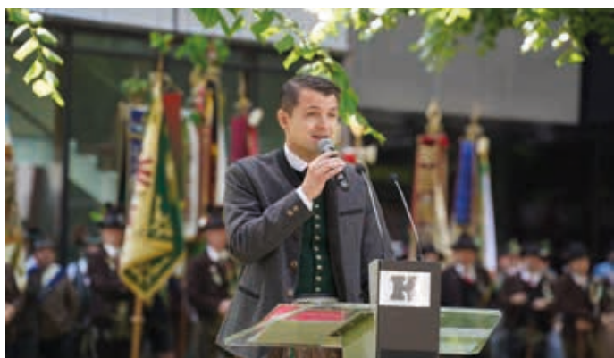
Bezirkshauptmann Kurt Berek bei seiner Festrede zu den Jubiläen.

das 100-jährige Gründungsjubiläum der Kaiserjäger Kufstein sowie das 75-jährige Bestehen des Unterinntaler Trachtenverbandes auf dem Programm. Aus dem gesamten Tiroler Unterland kamen befreundete Vereine und präsentierten sich bei einem riesigen Festumzug durch die Stadt. -be-