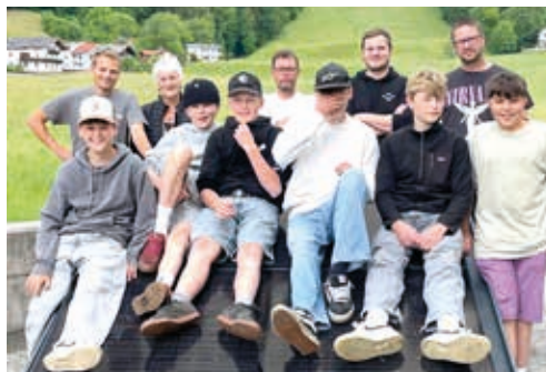
Das Jugendzentrum besuchte die Firma „Strom vom Dach“.