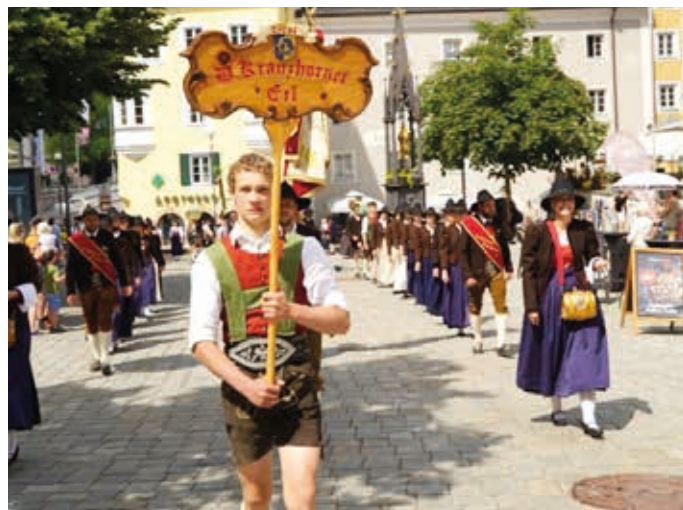
Auch die Kranzhorners aus Erl marschierten beim großen Festumzug mit.