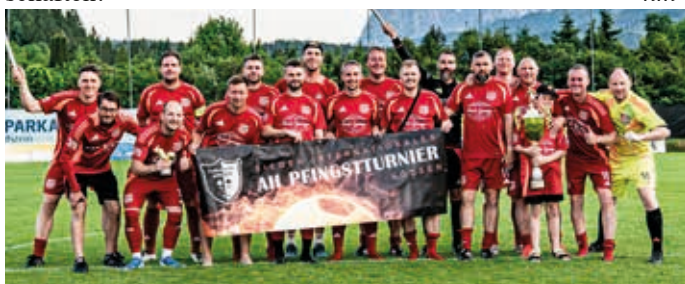
Die Sieger des Int. Pfingstturniers.