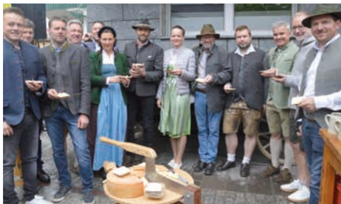
Käseanschnitt durch die Vertreter der regionalen Sennereien.