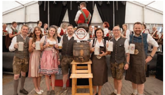
Die Vertreter der Vereine beim Bieranstich.

„Klobenstoana“, aber der Höhepunkt war der Umzug der alten Feuerwehrautos, welcher von zahlreichen Besuchern entlang der Straßen interessiert verfolgt wurde. Zum Egaschtfest gehören auch die unterschiedlichen Handwerker und künstlerischen Gestalter, deren Werke viele Abnehmer fanden. -be-