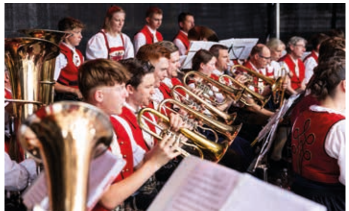
Zahlreiche Gruppen sorgen in der Kufsteiner Innenstadt für beste Stimmung.

Für das leibliche Wohl sorgen zahlreiche freiwillige Helfe-