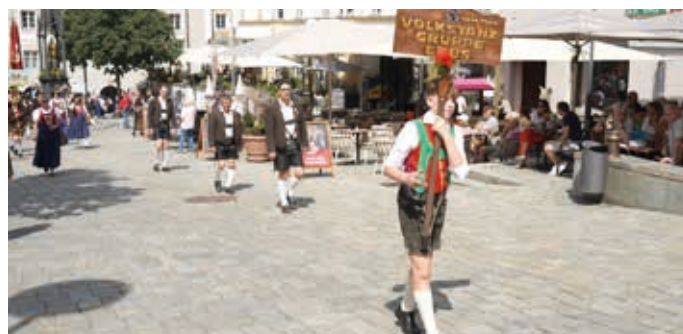
Die Volkstanzgruppe Ebbs.