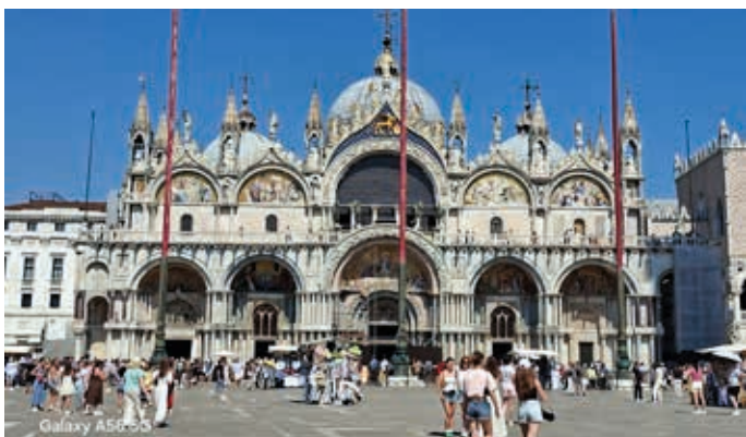
Der Markusplatz, mit ausnahmsweise wenigen Menschen.

Nach der Lebensweisheit „Der Weg ist das Ziel“ erfolgte die Leserreise des Tatzelwurmverlags mit dem Reisebüro Wechselberger in die Region Veneto. Chioggia, Padua und Venedig standen auf dem Programm.