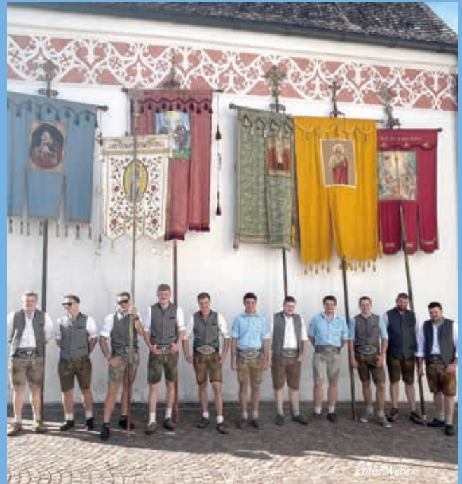
Die Fahnenträger der JB/LJ Niederndorf, Niederndorferberg und Retterschöss