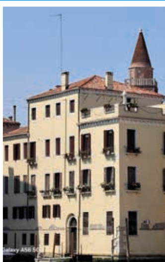
Die Dachterrasse von „Commissario Brunetti“ in Venedig. Bild rechts: Ein Teil der Reisenden vor der Basilika San Antonio.

Die Anreise erfolgte über Lienz und das Pustertal nach Cortina d'Ampezzo. „Kitzbüchel gefällt uns besser, da ist es nicht ganz so touristisch“, meinten einige Reiseteilnehmer beim Besichtigen der Olympiastadt. Bei der Weiterfahrt Richtung Adria