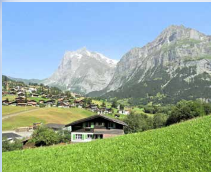
Das Lauterbrunnental, Ausgangspunkt zu den mächtigsten Bergen der Schweiz

streifen die Welt des ewigen Eises. Im bekannten Wintersportort Davos sind wir im bestens ausgestatteten 4* Hotel untergebracht und starten von dort unsere Ausflüge.