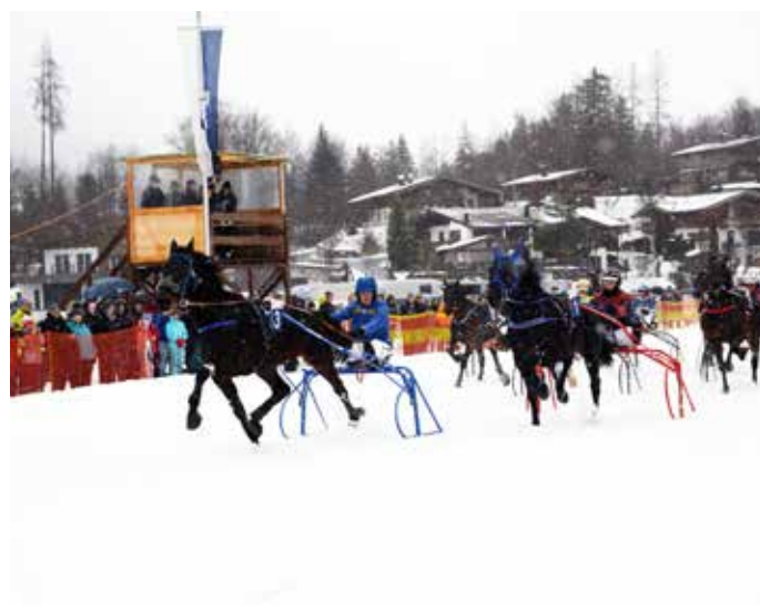
Gelungener Rennstart um das Goldene Hufeisen der Gemeinde Kirchdorf