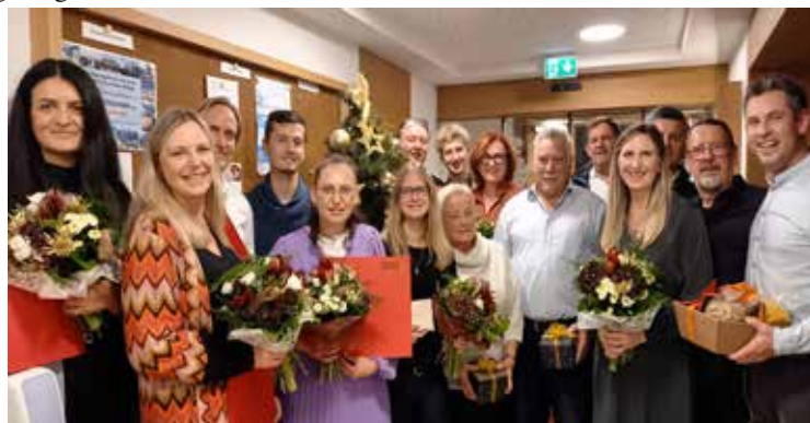
Die Jubilare und Pensionisten von Wechselberger Touristik