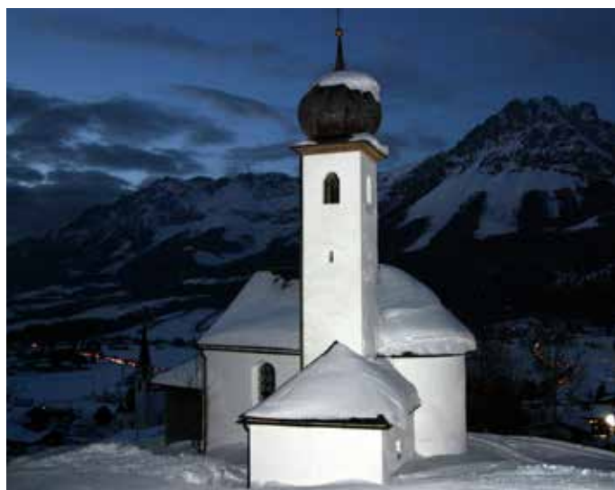
Die Maria Heimsuchungskapelle wurde 1719 erbaut und im Vorjahr musste wieder einmal das Dach erneuert werden