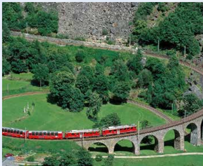
Die Rhätische Bahn (Bernina Express) mit ihrem berühmten Kreisel kurz nach Pontresina

Reise im Komfortbus 3-Gang-Mittagessen inkl. ¼ Wein, ½ Wasser u. Kaffee in Tirano 3 x ÜF im Central Sport Hotel**** Davos 3 x Abendessen (Halbpension) gratis Wellness im Hotel inkl. Hallenbad