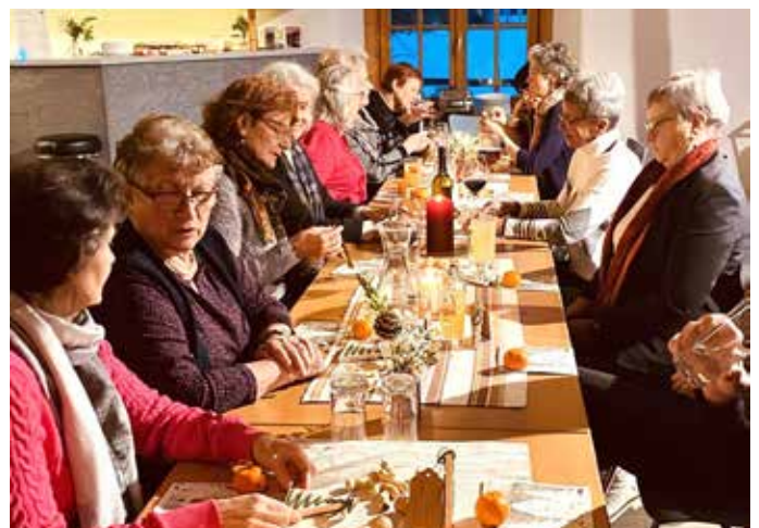
Adventfeier in geselliger Runde