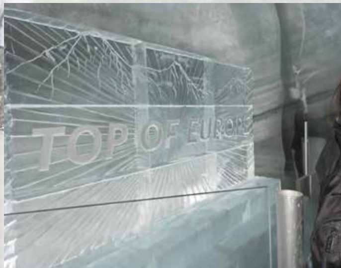
Im Eispalast auf dem Jungfraujoch

Bei der Anfahrt zum Hotel machen wir einen kurzen Halt in Einsiedeln, das dortige Kloster ist der bedeutendste Wallfahrtsort der Schweiz. Nachmittags besuchen wir Victorinox die bekannteste Taschenmesserproduktion der Schweiz.