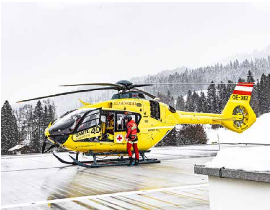
Christophorus 4 auf der neuen, modernen und sicheren Landeplattform des BKH St. Johann

Das Flugrettungswesen ist seit über 40 Jahren ein unverzichtbarer Baustein der notfallmedizinischen Gesundheitsversorgung in Österreich. Rund 800 Mal pro Jahr wird das Bezirkskrankenhaus St. Johann von Rettungshubschraubern angefliegen. Ein Großteil der Einsätze sind internistische und neurologische Notfälle, Unfälle in der Freizeit, bei der Arbeit oder im häuslichen Umfeld und Verkehrsunfälle – aber auch für Überstellungsflüge werden die Helitransporte intensiv genutzt. -red-