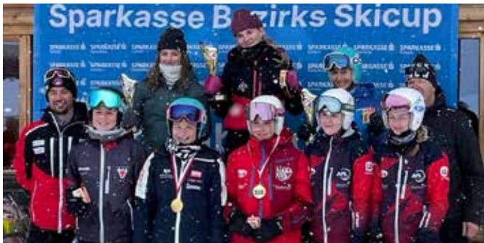
Bei den Schülerklassen waren mehr Mädels als Burschen am Start