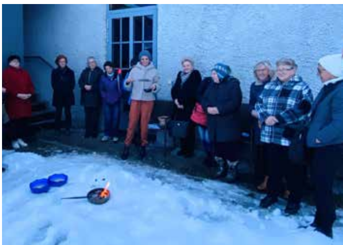
Verbrennen der Klagen-, Kummer-, Dank- und Bittschreiben