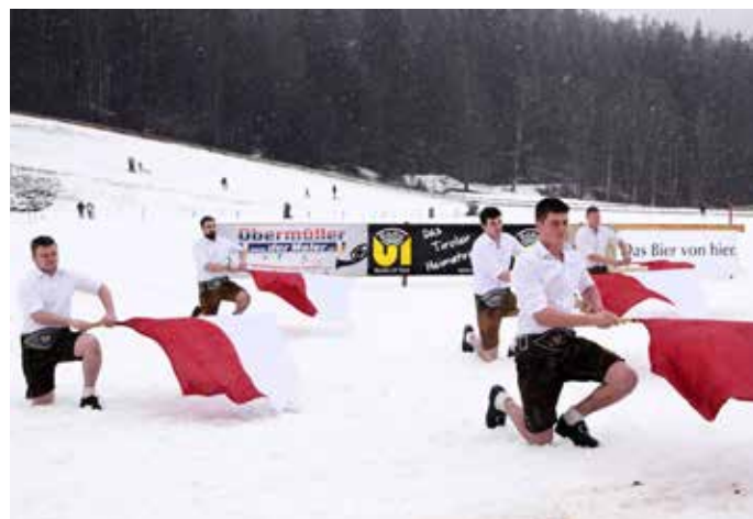
Fahenschwingen der Landjugend Kirchdorf/Erpfendorf