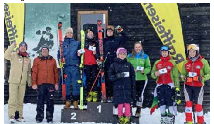
Klassensieger Schüler am Doischberg in Fieberbrunn