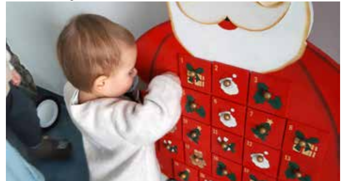
Was ist wohl heute drinnen?

Mit den flexiblen Öffnungszeiten unterstützt die KAPA Kinderstube vorwiegend berufstätige Eltern. So wurden auch während der Weihnachtsferien die Kinder liebevoll betreut. Bei Interesse an einem Krippenplatz für Ihr Kind bitten wir um rechtzeitige Anmeldung. Infos unter www.kapa-kinderstube.at . -red-