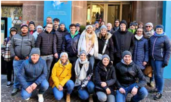
Die Sölländler am Archäologie-Museum in Bozen

Tags darauf stand noch ein Besuch im Archäologischen Museum in Bozen an, wo die Gruppe so manches über die Gletscherleiche „Ötzi“ und seine damalige Zeit erfuhr. Einig waren sich alle Teilnehmer darüber, dass es ein äußerst gelungener Ausflug gewesen war.