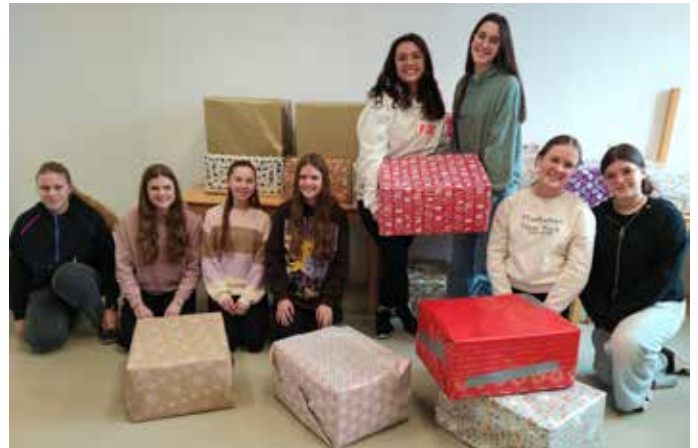
Die Caritas und die Rot-Kreuz Tafel wurden vor Weihnachten mit 46 Paketen unterstützt