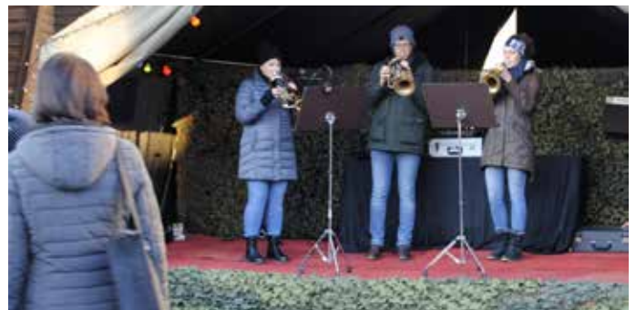
Große und kleine Musikanten spielten auf