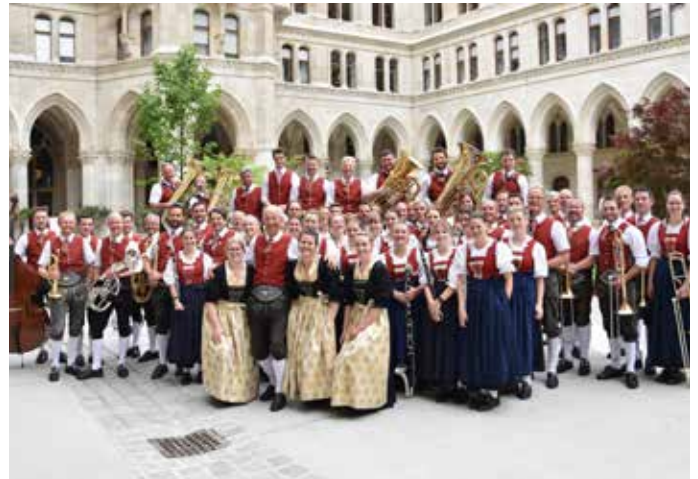
Die BMK Söll in Wien nach dem Bundessieg 2022 des Walzer-Polka-Marsch Wettbewerbes

Tanzmusi“ und die Brass-Band „Fättes Blech“ aus dem Allgäu. Am Samstag, 03.08.2024, sorgen die „Nord-Süd-Ost Böhmisches“ (Sieger des Grand Prix der Blasmusik 2023) und die bayrische Band „Saustoisimus“ für beste Unterhaltung. Tickets sind bereits unter www.summabrass.at erhältlich. Weitere Details folgen - bleibt gespannt! -red-