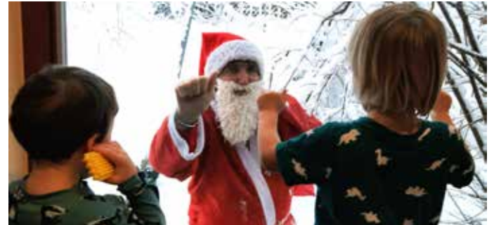
Besuch vom Nikolaus