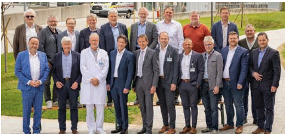
Die Bürgermeister des Bezirkes mit der Kollegialen Führung des Krankenhauses.