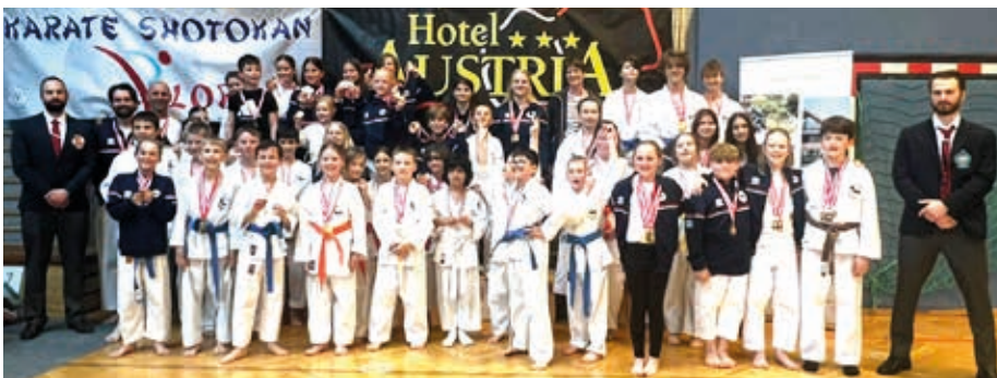
Das erfolgreiche Karate Team bei der Landesliga in Bruck.