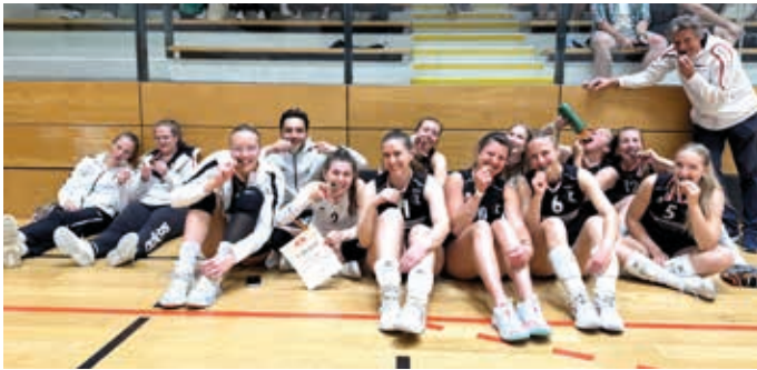
Überglücklich über den 3. Platz in der stark besetzten Landesliga A.

Ende April erreichten die St. Johannerinnen in Innsbruck beim Playoff-Finaltag (höchste Liga Tirols) in beeindruckender Manier den 3. Platz in der Landesliga A. Bereits zum vierten Mal in dieser Saison konnten sie sich gegen den VC Tirol durchsetzen, diesmal mit einem klaren 3:0 Sieg (25:22, 25:12, 25:21)! Mit Freudentränen, einer großen Portion Last, die von den Schultern fiel und vielen Gratulanten geht dieser Tag in die Vereinsgeschichte des VC St. Johann ein.