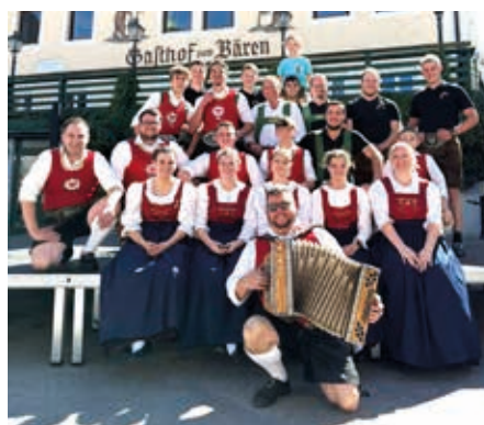
Gastauftritt des Trachtenvereins Edelweiß Fritzens.

Besucher und Mitglieder für die Unterstützung. -red-