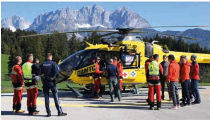
Infos aus erster Hand erhielten Einsatzorganisationen am C4-Stützpunkt in Reith.

Zahlreiche Vertreter von Einsatzorganisationen wurden kürzlich am C4-Stützpunkt in Reith über die Neuerungen in der Flugrettung im Bezirk informiert. Ab der Sommersaison wird der Christophorus 4 bis 21:30 Uhr einsatzbereit sein – bisherige Einsätze endeten mit Sonnenuntergang.