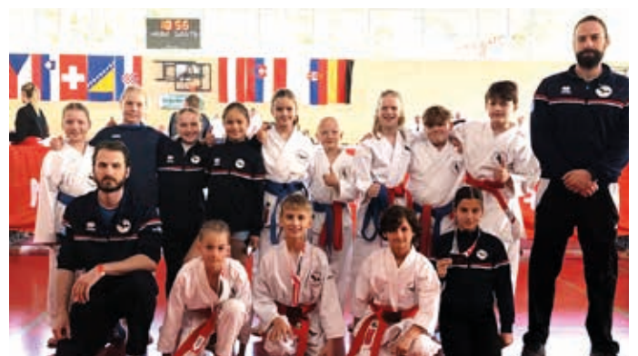
Die Kata-Teams U10 und U14 holten Eurocup-Bronze in Mittersill.