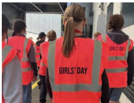
Die Mädchen konnten bei der Firma EGGER hineinschnuppern.

Der Girls' Day ist ein einmal jährlich stattfindender, integrativer österreichweiter Aktionstag. Das Ziel ist es, Mäd-