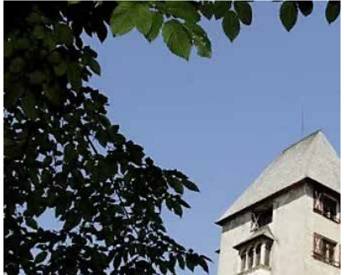
Früher für Feinde unbezwingbar, heute ein schönes Ausflugsziel und Hotel: das Schloss Matzen in Reith im Alpbachtal

Für die Zeit nach ihrem Tod sagte die Hellseherin eine weitere Invasion aus Bayern voraus. Mit heißem Pech, das jeden Tag auf die Angreifer gegossen werden sollte, würden die Tiroler die Eindringlinge nach sieben Tagen für immer vertreiben. Die Verteidigung gelang. „Matzen ist nicht zu nehmen,“ sollen die Bayern gesagt haben, bevor sie für immer von dannen zogen.