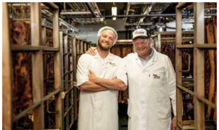
Die Kitzbüheler Metzgerei Huber feiert 2022 ihr 210 jähriges Jubiläum als Familienbetrieb.

Tipp: Die Original Kitzbüheler Speckspezialitäten sind nicht nur besonders schonend gereift und geräuchert, sondern auch zertifiziert als Tiroler Speck g.g.A.