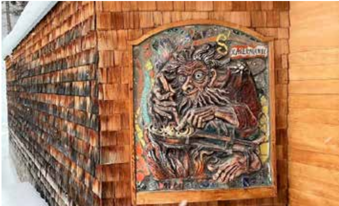
Das Kasermandl als Relief

Oberhalb von Innsbruck auf der alten Umbrügler Alm soll einst ein verschwenderischer Senner gelebt haben, der etwa Butterkugeln zum Kegeln missbraucht haben soll. Die Strafe für die Prasserei folgte nach seinem Tod. Der Geist des Senners wurde dazu verdammt, jeden Winter auf verschiedenen Hütten Tirols als Kasermandl zu hausen. Der kleine Waldgeist kann sehr boshaft werden, wenn man ihn reizt. Zugleich soll aber auch Gutes in ihm schlummern: Eine arme Magd sollte in der Nacht auf der Wattener Alm das gefürchtete Kasermandl ausspionieren. Als Belohnung wurde ihr eine Kuh versprochen. Aber nachdem die Magd heil zurückgekehrt war, wollte der Bauer nicht Wort halten. Plötzlich starb jeden Tag eine Kuh in seinem Stall, bis der Bauer sein Versprechen einlöste.