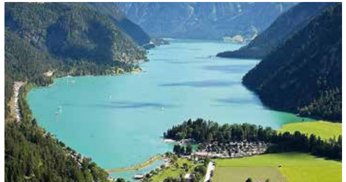
Wer kann die Kirchenspitze erkennen?

Eine reiche Ortschaft soll dort gestanden haben, wo heute der Achensee liegt. Die Bewohner sollen stolz und ohne Mitleid für arme Menschen gewesen sein. Als eines Tages ein fremder, uralter Mann von Haus zu Haus ging, um Essen und eine Unterkunft zu erbeten, wurde er verspottet und verjagt. Der Alte ging bergwärts Richtung Oberautal bis zur Höhe des Fonsjochs und verfluchte das Dorf. Gewaltige Regenschauer und Sturzbäche ließen das Dorf in den Fluten für immer versinken. Der Alte soll in dem Gebiet heute noch schlafen und jedes Frühjahr streckt er sich im Schlaf, was manchmal Lawinen verursachen soll. Sonntagskinder reines Herzens sollen an klaren Tagen die Kirchturmspitze des versunkenen Dorfes im See erkennen.