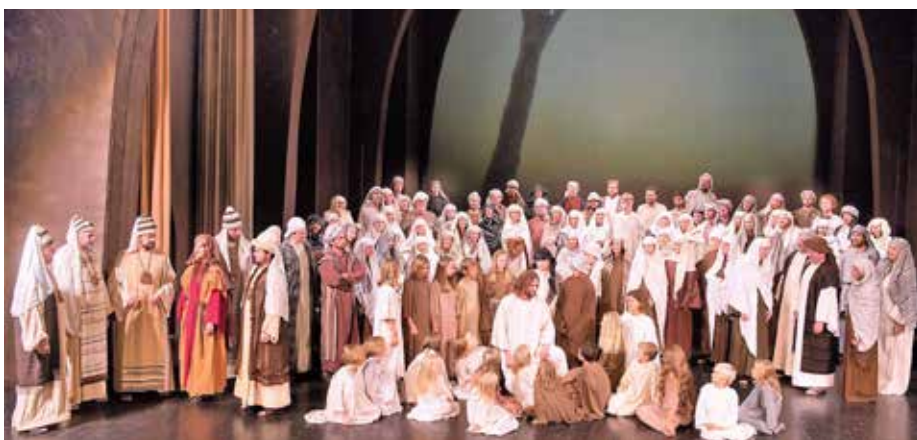
Über 200 Laiendarsteller/innen sind involviert, hinzu kommen die Beteiligten hinter der Bühne