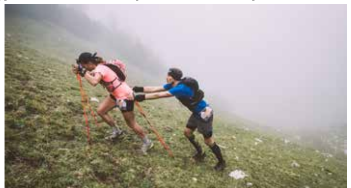
Schnupperer können NUR zwei Etappen über 74km (4000 Hm) laufen