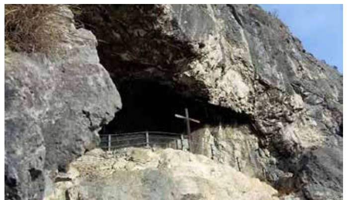
Heute erinnert ein Kreuz in der Kaiser-Max-Grotte an diese besondere Rettung