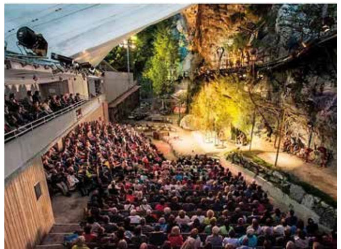
Die Geierwally-Bühne in Elbigenalp

Infos Tourismusverband Lechtal und www.geierwally.at