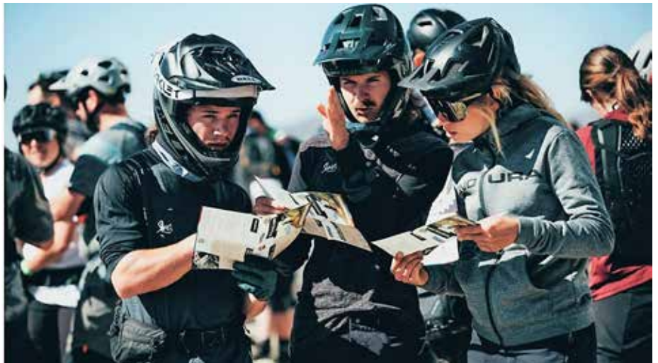
Die Bike Republic Rallye findet im Rahmen des dreitägigen Bike-Opening am 11. Juni statt

Eine Zeitmessung gibt es bei dem Enduro-Fun-Race nicht: Statt um Bestzeiten geht es darum, beste Zeiten mit dem Team und