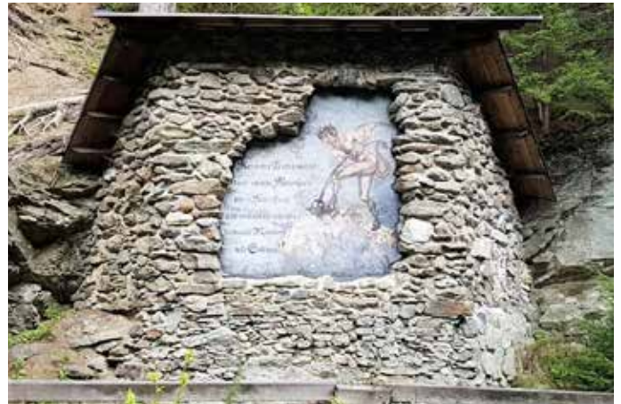
Das Bildnis des Teufels erinnert an den vermeintlichen Erbauer der Mühle

Der Teufel willigte ein und machte sich eifrig ans Werk. Die Mühle war bald aufgebaut. Den Mühlstein musste der Teufel aus dem Inntal holen, was sehr beschwerlich war und länger dauerte als gedacht. Als er fix und fertig mit dem Stein ankam, krächte der Hahn zum ersten Mal. Der Bauer gab dem Stein einen Stoß. Dieser rollte wieder ins Tal, der wütende Teufel hinterher. Der Bauer lachte sich ins Fäustchen und taufte seine neue Mühle „Teufelsmühle“.