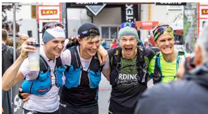
Ein Teambewerb nach dem Motto „gemeinsam schaffen wir das“

Infos & Anmeldung zum Trailrunning Event für Teams – in 8 Tagen zu zweit über die Alpen unter www.transalpine-run.com .