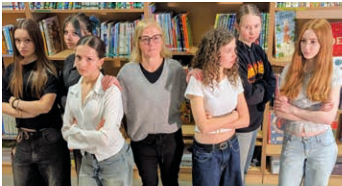
Als die Töchter von der tödlichen Krankheit ihrer Mutter erfahren, folgen unvermeidliche familiäre Turbulenzen.

Ende Mai stehen die Mitglieder der Theatergruppe wieder auf der Bühne. Das Stück „Meine Töchter“ wurde eigens für die Theatergruppe der Schule geschrieben.