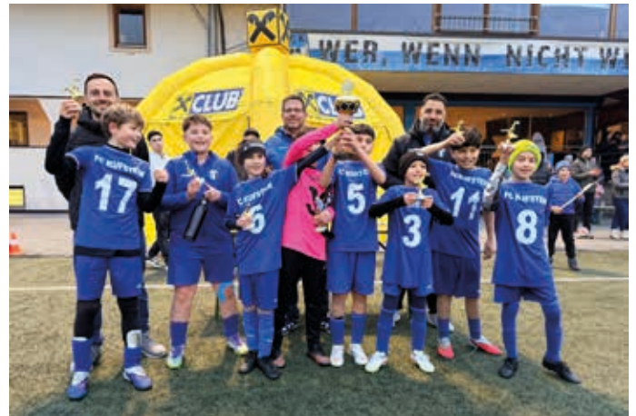
U11-Turniersieger FC Kufstein im Freudentaumel.

98 Mannschaften aus Tirol, Salzburg und Bayern trafen sich an zwei Wochenenden im März zum sportlichen Kräftenessen in Kirchberg. Der für den 28. März geplante Spieltag für die U7 und U8 wurde aufgrund von Schneefall abgesagt. Mit 820 Spielenden und 285 ausgetragenen Spielen war dennoch für reichlich Fußballaction gesorgt.