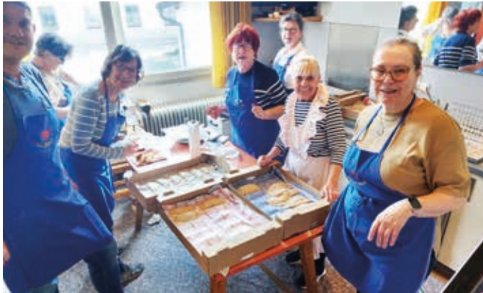
Die erfahrenen Krapfenköchinnen.