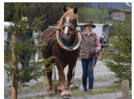
Einige Noriker bewiesen ihre Verlässlichkeit beim Geschicklichkeitsparcours.