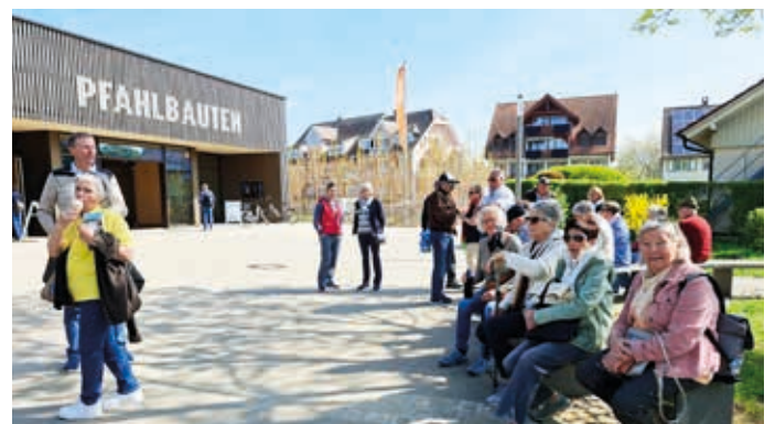
Pause bei den Pfahlbauten in Unteruhldingen.