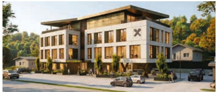
Visualisierung des neuen Raiba-Kompetenzzentrums in Hopfgarten.

Die Gesamtnutzfläche des neuen Areals beträgt 2.250 m 2 . „Dieses Kompetenzzentrum mit Tiefgaragenplätzen ist unser klares Ja zur Eigenständigkeit und zur Stärke der Region Wilder Kaiser – Brixental. Es wird kein Prestigeobjekt, sondern eine wirtschaftliche Bank für die nächsten Jahrzehnte“, ist sich der Vorstand einig. -be-