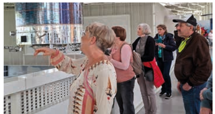
Auch Satelliten und der Weltraum sind Thema im Dornier Museum.

Das Allgäu ist bekannt für seine Obstkulturen und dementsprechend viele, in allen Farben blühenden Bäume, erfreuten die Reisenden. Auf Schloss Linderhof genossen wir einen prachtvollen Rundgang in der Morgensonne und ohne viel weiteres Publikum. Als äußerst interessant erwies sich die Führung durch das Dornier Museum. Claude Dornier hat nicht nur Flugzeuge erfunden, sondern auch den ersten Nierensteinertrümmerer und elektronischen Webstuhl, mit dem heute auch Folien hergestellt werden. Kindheitserinnerungen wurden wach, als wir durch das Spielemuseum Ravensburg geführt