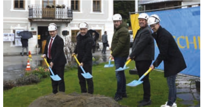
Spatenstich am 11. April, die Arbeiten beginnen Anfang Mai und sollen bis Juni abgeschlossen sein.

ein Gastronomiebereich, welcher allerdings frühestens zur Wintersaison eröffnet werden kann, sofern ein Betreiber dafür gefunden wird. -be-