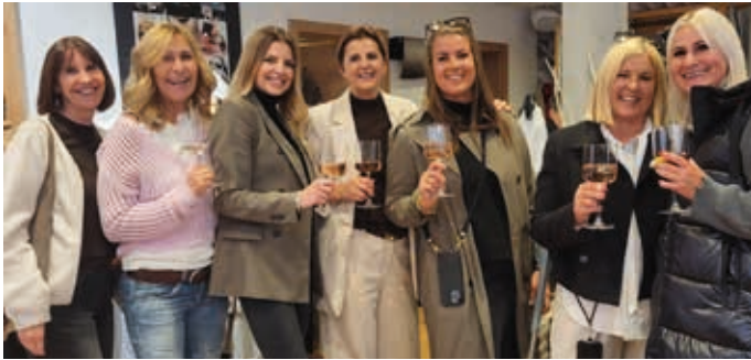
Beste Stimmung beim MAI(n) SHOPPING: entspanntes Bummeln, Einkaufen und Entdecken in den Hopfgartner Betrieben.

Am Freitag, 8. Mai 2026 steht Hopfgarten wieder ganz im Zeichen eines frühlingshaften Einkaufserlebnisses. Nach dem gelungenen Auftakt im Vorjahr und der erfolgreichen Herbst-Ausgabe lädt das MAI(n) SHOPPING unter dem Motto „Einkaufen & Genießen“ zum entspannten Bummeln, Einkaufen und Entdecken im Hopfgartner Markt ein – mit verlängerten Öffnungszeiten bis 20 Uhr.