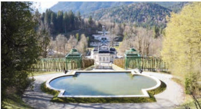
König Ludwigs Schloss Linderhof inmitten eines riesigen Parks.

Schloss Linderhof im Allgäu, das Dornier-Flugzeugmuseum in Friedrichshafen, das Spielemuseum in Ravensburg, die Garteninsel Reichenau und viele Reiseeindrücke – begeisterte die Gruppe, die sich von Freitag bis Sonntag am Bodensee und im Allgäu aufhielt.