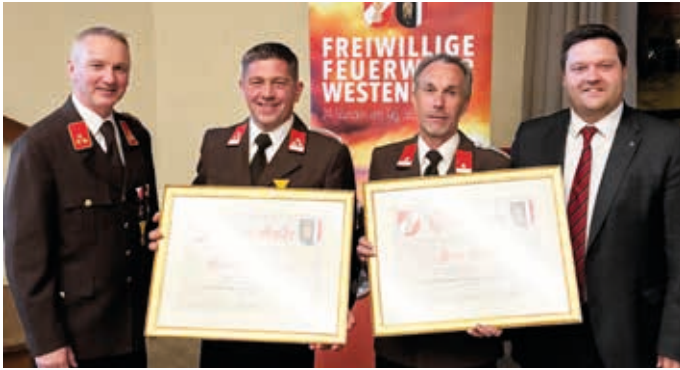
Ehren-Urkunden für 40-jährige Mitgliedschaft.