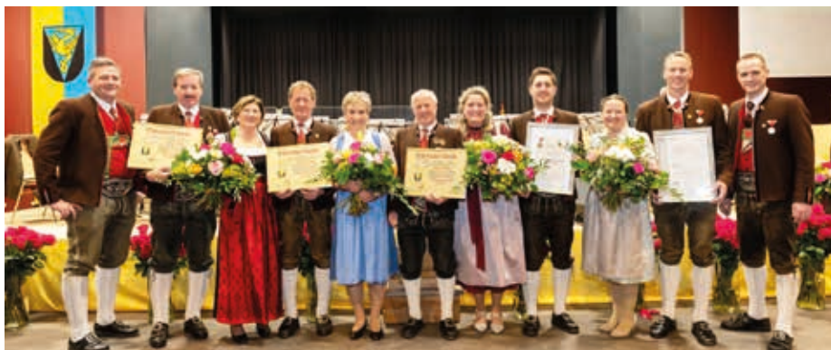
Die geehrten Musikanten mit ihren Ehefrauen.