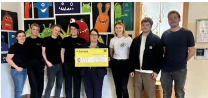
Zweitliebe und Genussverein überreichen € 857 + € 200 an die Volksschule Hopfgarten.

Am 20. März 2026 waren alle 100 angebotenen Kleiderständer in kürzester Zeit vergeben. Das Verkaufskonzept mit vorab Reservierung sowie Organisation und Verkauf durch das Zweitliebe-Team bewährte sich erneut.